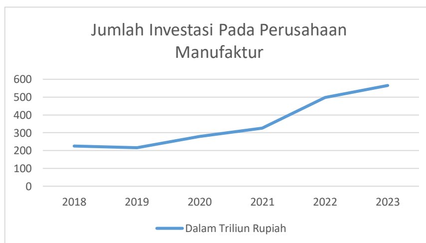
Gambar 1. Jumlah Investasi Pada Perusahaan Manufaktur

Perusahaan manufaktur menjadi salah satu sektor yang banyak diminati oleh masyarakat terutama dalam investasi. Hal tersebut disebabkan karena perusahaan manufaktur merupakan perusahaan yang berskala besar dan memiliki suplai yang cukup tinggi mengingat negara Indonesia merupakan negara berkembang. Industri manufaktur berperan penting dalam upaya menggenjot nilai investasi dan ekspor sehingga menjadi sektor andalan untuk mengakselerasi pertumbuhan ekonomi. Berikut ini disajikan peningkatan jumlah investor pada sektor manufaktur yang mengalami pertumbuhan yang cukup baik selama tahun 2018-2023.